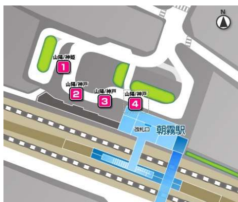
○朝霧駅バスターミナル○

◆JR 神戸線・山陽電鉄 明石駅より 80 系統『明舞団地』行き乗車 (神姫①乗り場) 『明舞中央病院前』下車すぐ