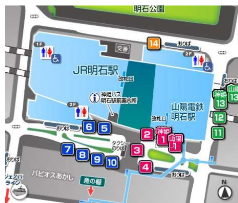
○明石駅バスターミナル○